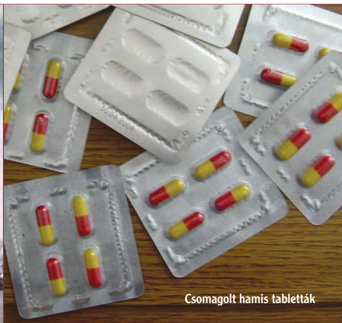
Csomagolt hamis tabletták

Az életével játszik, aki hamis, nem megbízható forrásból származó gyógyszert vásárol, illetve fogyaszt – figyelmeztetnek évről évre a nemzetközi és magyar hatóságok. Ennek ellenére a hamisítás virágzó üzlet – a világon kapható, gyógyszerként árusított termékek egytizede hamisítványnak tekinthető.