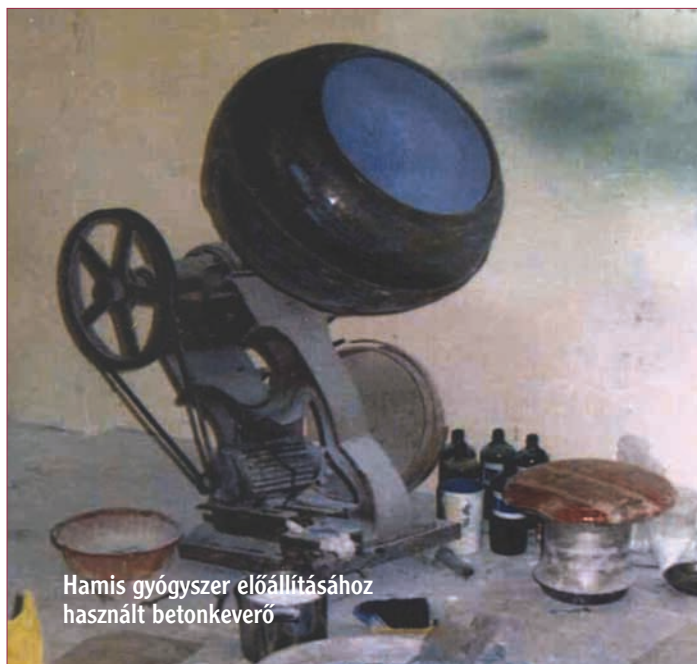
Hamis gyógyszer előállításához használt betonkeverő