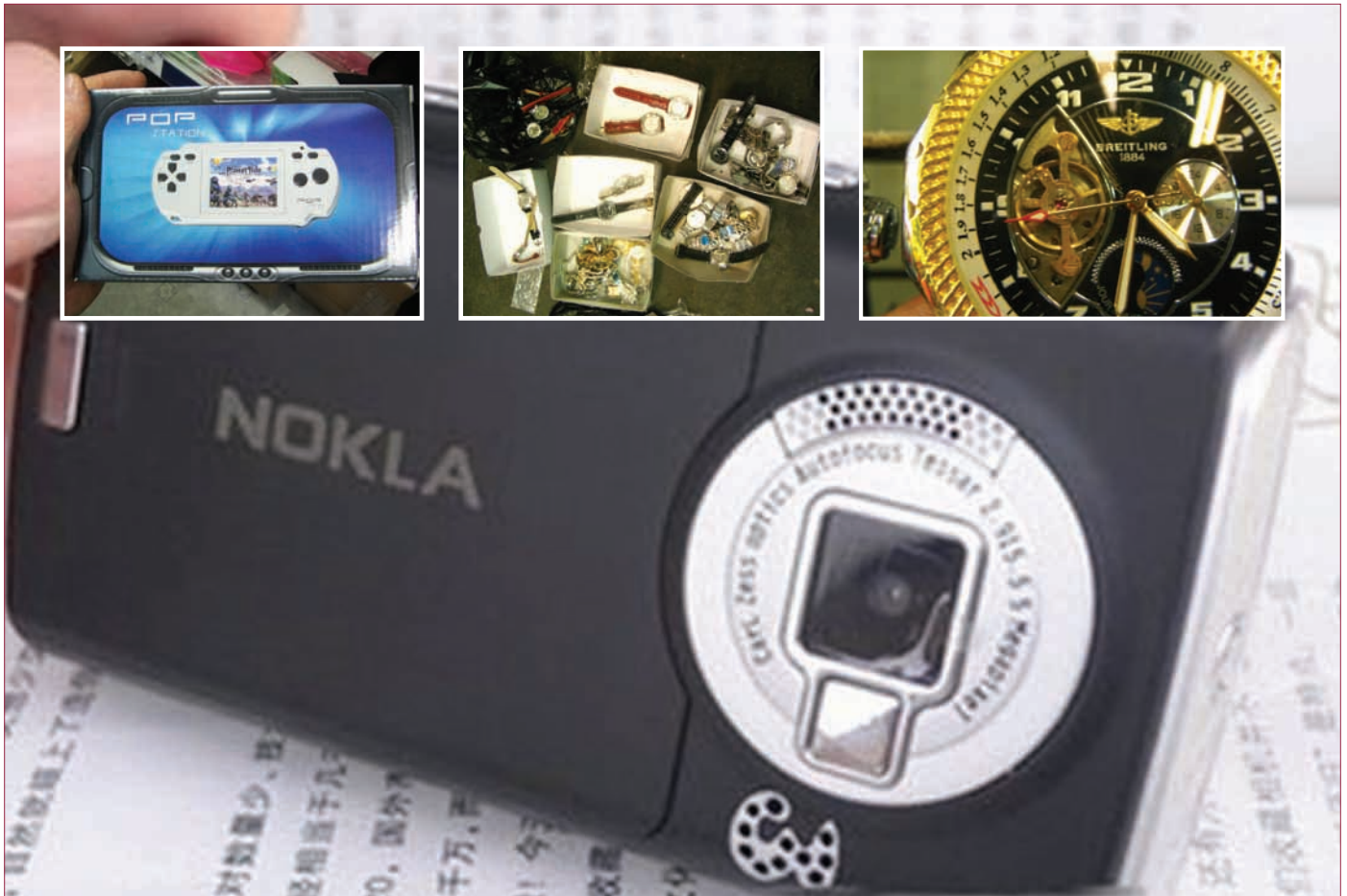
Hamis, lefoglalt termékek

Bármilyen alkalmi vételnek is tűnhet, egy már gyanúsán olcsó mobilkészülék, televízió vagy kábel megvásárlása, majd használata komoly veszélyt jelenthet a fogyasztók biztonságára és testi épségére nézve. A hamis elektronikai cikkek előállításánál nem a biztonsági előírások és a gyártási standardok betartását, hanem a minél kisebb előállítási költséget, és így a minél nagyobb profit elérését tartják szem előtt a gyártók. Éppen ezért az ilyen termékek különösen balesetveszélyesek lehetnek: sérüléseket, áramütést okozhatnak, könnyen meggyulladhatnak.